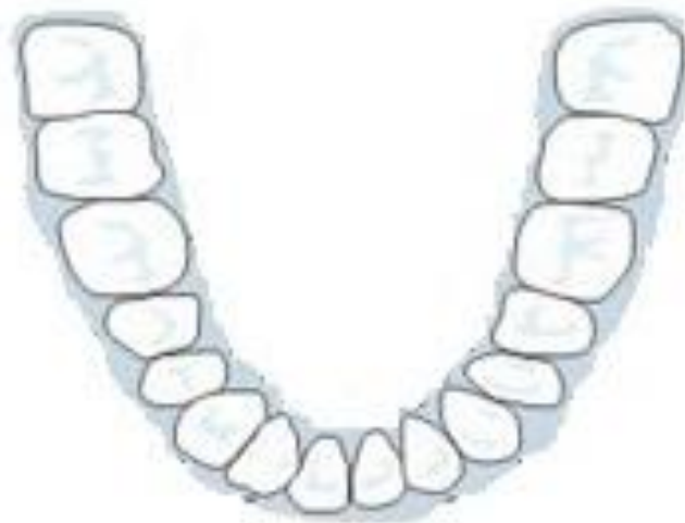
④就診者假牙裝置前照片 (以鏡像拍出下顎全部)