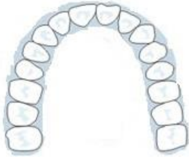
③就診者假牙裝置前照片 (以鏡像拍出上顎全部)