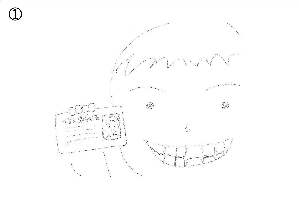
①就診者臉部正面露齒照 (相片須同時附上身份證，放於右臉頰旁位置)