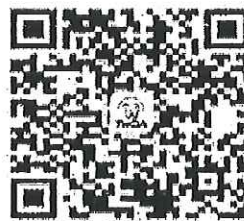
請加入牙醫全聯會LINE@