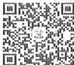
請加入牙醫全聯會LINE@

發文日期：中華民國 111 年 04 月 19 日 發文字號：牙全志字第 01261 號 速別： 密等及解密條件或保密期限：普通 附件：詳如說明