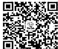
請加入牙醫全聯會LINE@

發文日期：中華民國 111 年 5 月 5 日 發文字號：牙全志字第 01343 號 速別：普通件 密等及解密條件或保密期限：普通 附件：報名回函表