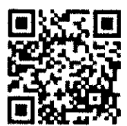
掃描 QR code 線上報

*敬請於各場次報名截止日前回傳或回電知會本會，或掃描 QR code 線上報名，謝謝。本會傳真：(02)25000126、本會電話：(02) 25000133 轉 212 E-mail: r545566g@cda.org.tw 聯絡人: 蘇庭柔