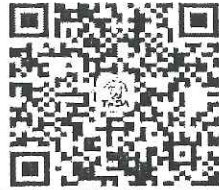
請加入牙醫全聯會LINE@

附件：衛生福利部食品藥物管理署112年8月21日FDA藥字第1121409360號函