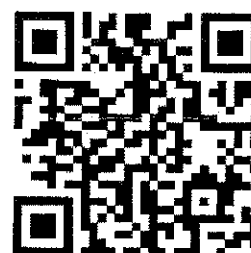
掃描 QR code 線上報名