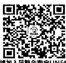
請加入牙醫全聯會LINE@

發文日期：中華民國113年3月26日 發文字號：牙全仁字第01085號 速別：普通件 密等及解密條件或保密期限：普通 附件：衛生福利部113年3月12日衛部照字第1131560194C號函