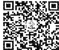
請加入牙醫全聯會LINE@