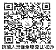
請加入牙醫全聯會LINE®

正本：台北市牙醫師公會、新北市牙醫師公會、宜蘭縣牙醫師公會、花蓮縣牙醫師公會、基隆市牙醫師公會、桃園市牙醫師公會、新竹市牙醫師公會、新竹縣牙醫師公會、苗栗縣牙醫師公會、臺中市大臺中牙醫師公會、台中市牙醫師公會、彰化縣牙醫師公會、南投縣牙醫師公會、台南市牙醫師公會、雲林縣牙醫師公會、嘉義縣牙醫師公會、嘉義市牙醫師公會、屏東縣牙醫師公會、高雄市牙醫師公會、澎湖縣牙醫師公會、台東縣牙醫師公會、金門縣牙醫師公會 國立台灣大學牙醫學系校友總會、台北醫學大學牙醫學系校友總會、高雄醫學大學牙醫學系校友總會、中山醫學大學牙醫學系校友總會、國防醫學院牙醫學系校友聯誼總會、國立陽明大學牙醫學系校友總會、中國醫藥大學牙醫學系校友會總會