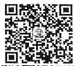
請加入牙醫全聯會LINE@