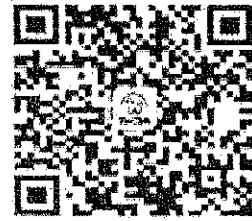
請加入牙醫全聯會LINE@